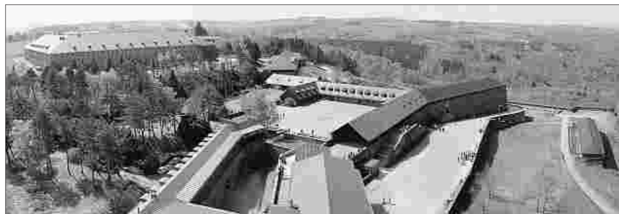
Soll im Zuge der EuRegionale 2008 sinnvoll genutzt werden: Camp Vogelsang in der Eifel.

@ EuRegionale 2008 im Internet: www.euregionale2008.de www.vogelsang-ip.de